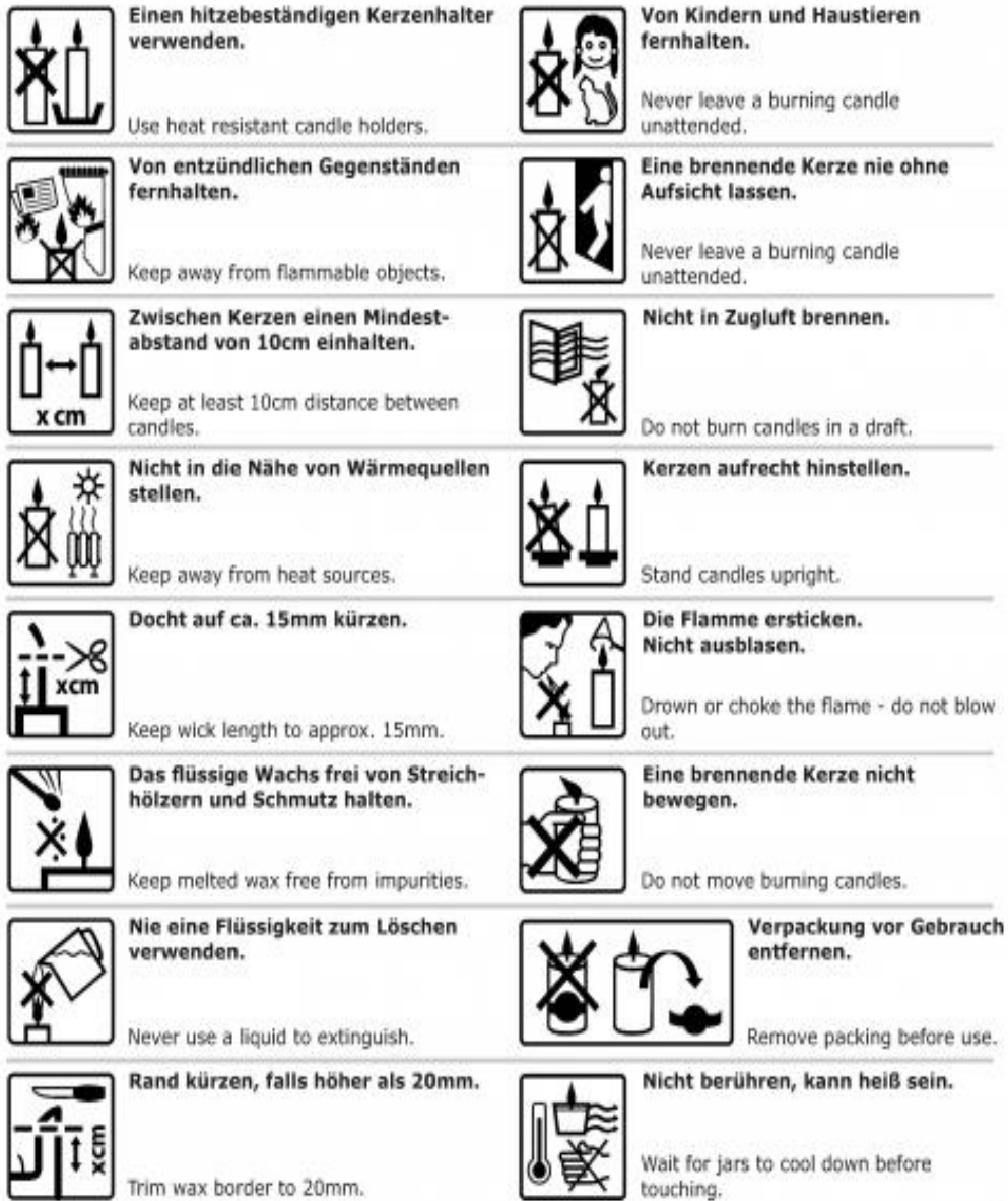
Schwimmkerzen / Floating candles

Please take note of the following safety instructions when burning candles